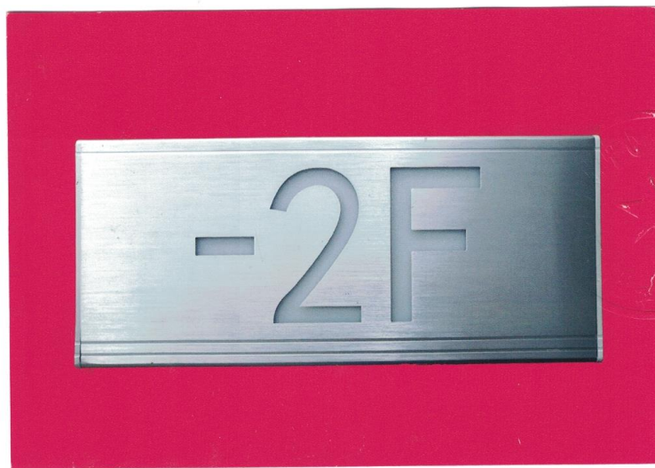
产品型号: Z-BLJC-1LR0E II 1W-1425 (图 B. 6 -2F)