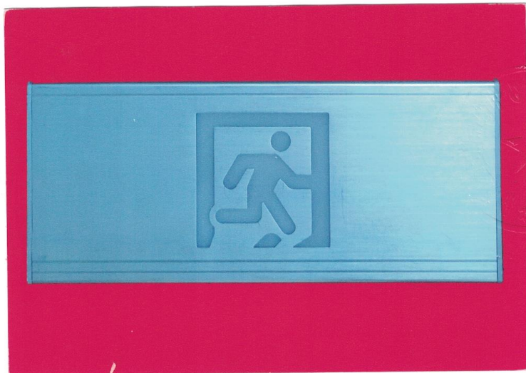
产品型号: Z-BLJC-1LR0E II 1W-1425 (图 B. 2)