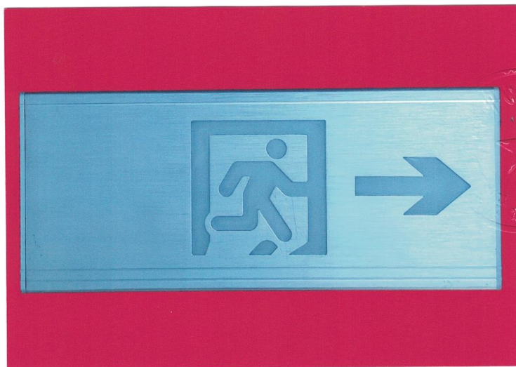
产品型号: Z-BLJC-1LR0E II 1W-1425 (图 B. 2+图 B. 5)