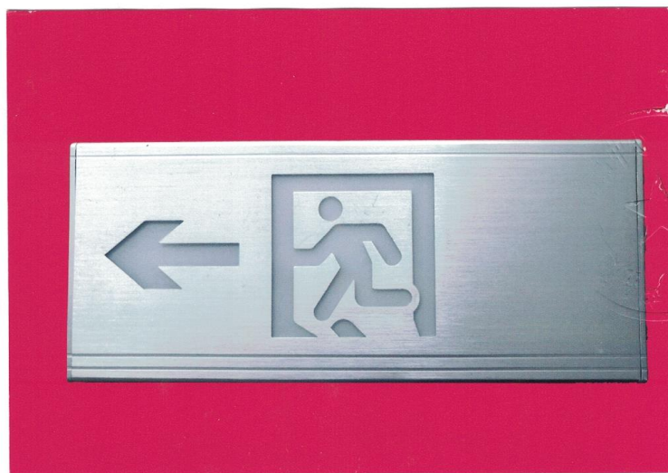
产品型号: Z-BLJC-1LR0E II 1W-1425 (图 B. 1+图 B. 5)