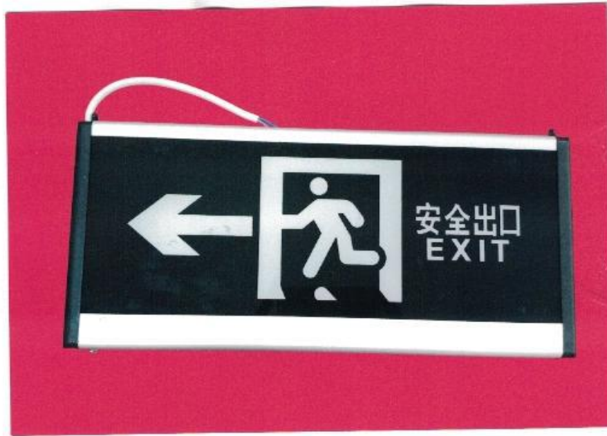
产品型号: Z-BLZD-1LR0E I 3W-0314 (图 B. 1+图 B. 5)