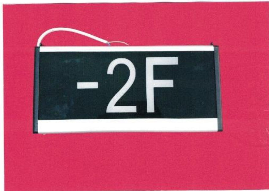
产品型号: Z-BLZD-1LR0E I 3W-0314 (图 B. 6 -2F)