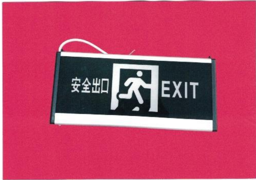
产品型号: Z-BLZD-1LR0E I 3W-0314 (图 B. 2)