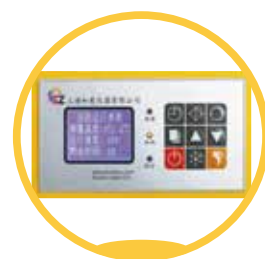
LCD 大屏幕背光液晶显示