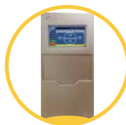
7寸真彩触摸屏 一体式设计插页框